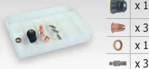
Scatola di consumabili 039971