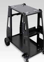
Carrello PLASMA 600 040298