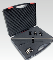
Kit compasso 040205